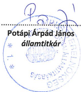
Potápi Árpád János államtitkár

A Bizottság utasítja a Bethlen Gábor Alapkezelő Zrt-t, hogy a jelen döntésben foglaltak végrehajtása érdekében a szükséges intézkedéseket tegye meg.