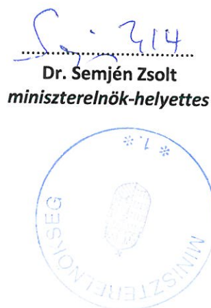
Dr. Semjén Zsolt miniszterelnök-helyettes